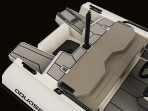
Badeleiter - Schleppöse | Bathing ladder - tow eye