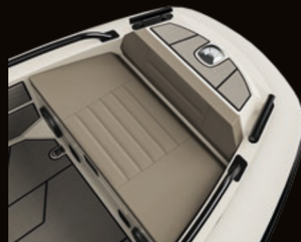
Bugstufe | Bow step