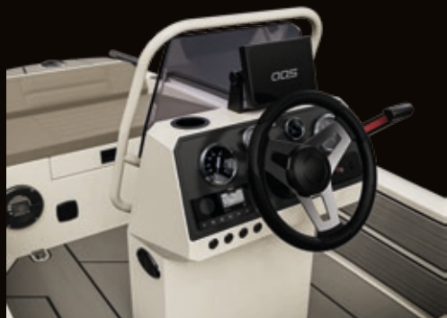
Klappbare Konsole - foldable console