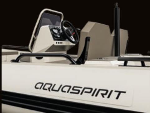
Alu Reling und Klampen | Alu handles and cleats